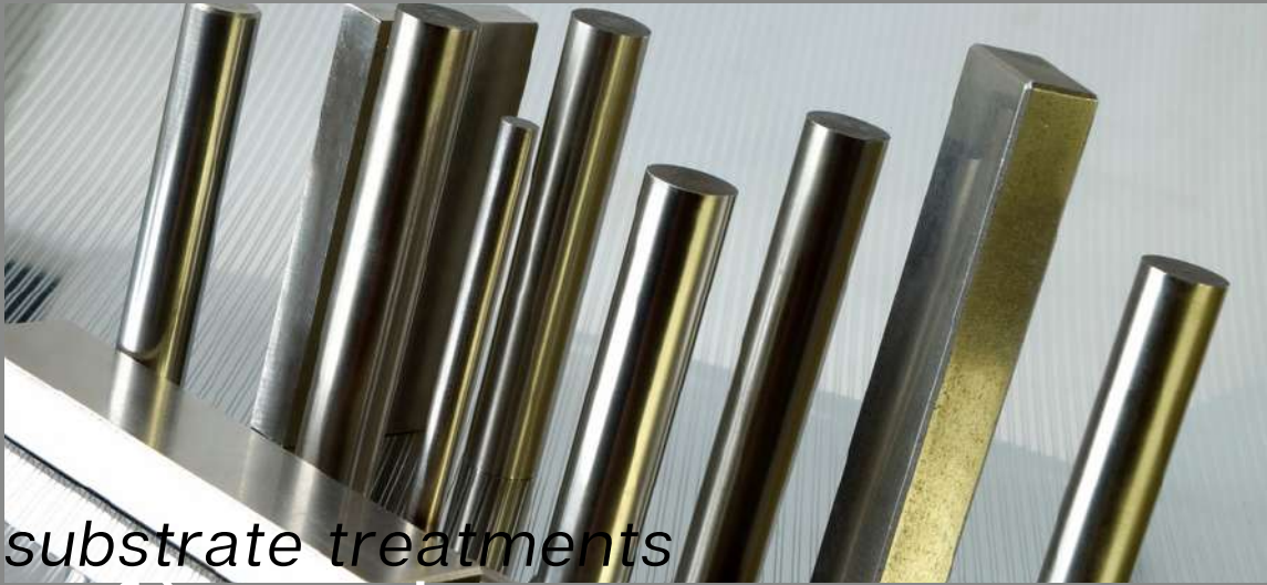
substrate treatments orfèvrerie